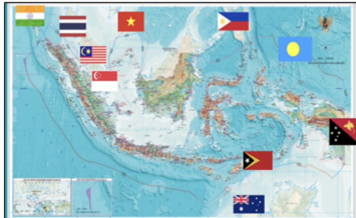
Pembicara: Arif Havas Ogrosono (Duta Besar LBBP RI untuk Republik Federal Jerman)

Gambar di atas mendeskripsikan bahwa Indonesia selain memiliki wilayah perairan yang luas juga memiliki jarak yang berdekatan dengan negara Asia lainnya yang dihipit oleh wilayah perairan besar seperti Samudra Pasifik, dan Samudra Hindia dan berada di salah satu kawasan perairan terbesar yaitu Laut China Selatan yang menjadi titik perlintasan internasional baik di alur laut maupun lintasan penerbangan yang ada di ruang udara. Indonesia dengan posisi strategis ini memicu keinginan negara China untuk dapat menguasai dan memiliki wilayah perairan Natuna dengan menggambarkan Sembilan garis putus-putus di Zona Ekonomi Eksklusif laut Natuna Utara sebagai bagian dari wilayah perairannya padahal, Zona Ekonomi Eksklusif laut Natuna Utara adalah bagian dari wilayah perairan Indonesia. Zona Ekonomi Eksklusifnya terhitung dari garis pangkal yang terhitung dan ditarik dari daratannya yaitu, pulau Natuna. Sembilan garis putus-putus yang digambar oleh China ke dalam peta wilayahnya sebagai berikut: